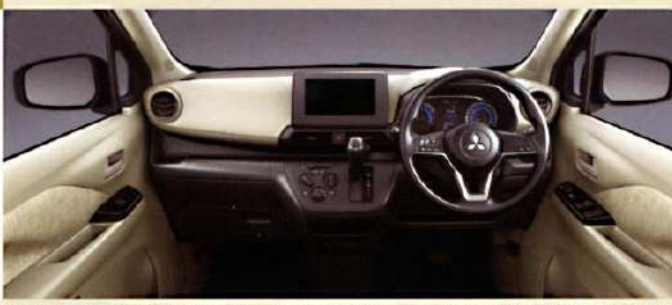
Photo:eKワゴン M 2WD ナビ取付パッケージ装着車 ボディカラー:オークブラウンメタリック(有料色:33,000円高/消費税別価格:30,000円高) ●撮影のために点灯 ●インテリア写真はカットボディによる撮影