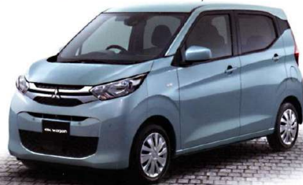
Photo:eKワゴン Joy Field 2WD ボディカラー:ミントブルーメタリック ●その他のボディカラー(一部、有料)がございます。●装備・諸元につきましては、ベース車となるeKワゴンカタログをご確認ください。●写真はイメージです。●価格は消費税別 ●保険料、税金(除く消費税)、登録などに伴う費用は別途申し受けます。●リサイクル料金が別途必要となります。●メーカーオプション選択時に価格が変更になります。●一部選択できないメーカーオプションがあります。●*2 価格は本体価格に加え、取付工賃(6,600円/時間)+消費税(10%)も含まれています。

令和元年度自動車アセスメント(JNCAP)*において、 予防安全性能評価「ASV+++」と衝突安全性能評価の 最高ランク「ファイブスター賞」をダブルで受賞。 *1 JNCAP(Japan New Car Assessment Program): 国土交通省と独立行政法人 自動車事故対策機構(NASVA)による、 自動車の安全性能試験・評価の略称。